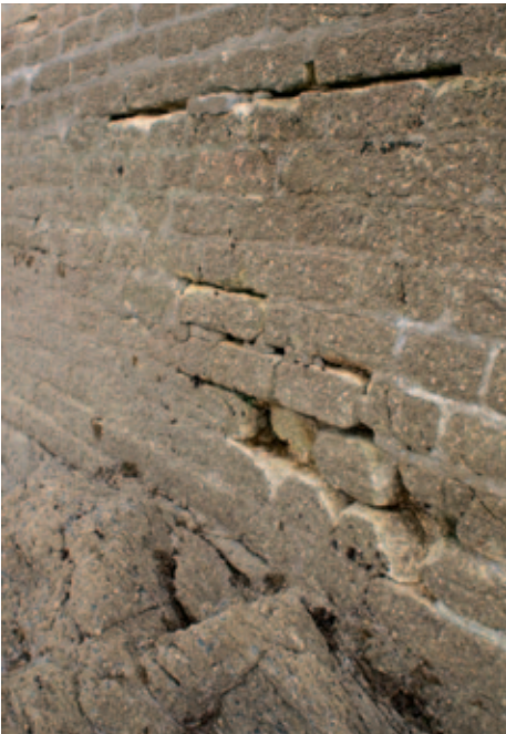
Le môle de Brigneau

Afin d'alléger les dépenses des budgets portuaires, les services techniques assurent désormais l'entretien paysager (nettoyage, fleurissement) et effectuent tous les travaux possibles en régie.