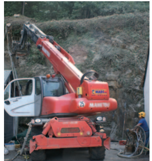
La falaise du port du Bélon

Le budget communal a prévu 35 000 € pour cette réalisation. ■