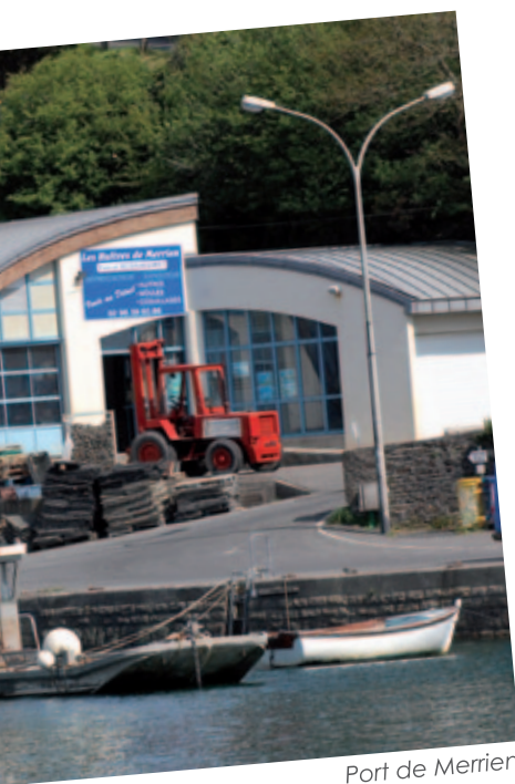
Port de Merrien