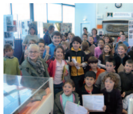
Exposition 2009 : visite d'une classe de l'école de Kermoulin

Contacts : Hélène Le Pocher : 02 98 39 72 36 Marie Claude Le Roux : 02 98 39 62 56 Mail : memoiresetphotos@orange.fr