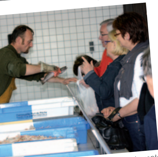
Port du Bélon, étal de vente