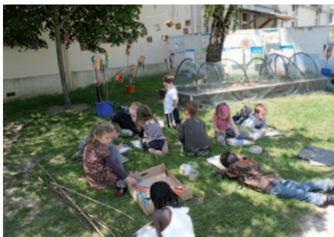
Séance finale de dessin pour les enfants