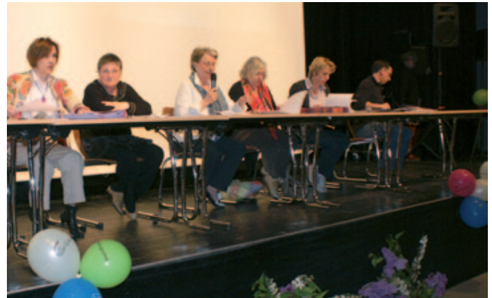
Ellipse, assemblée générale d'Ides

Cette soirée a permis de marquer une reconnaissance du travail produit par les permanents et le rôle de proximité des élus et bénévoles entre l'association et ses clients.