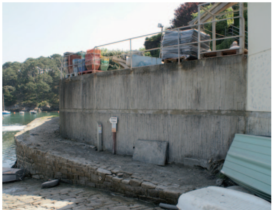
Cale et sentier côtier à Merrien