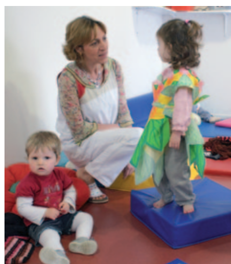
Activité dans la salle de motricité