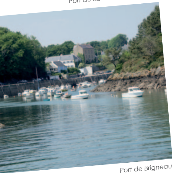
Port de Brigneau