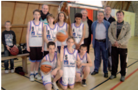
L'équipe des benjamins et les dirigeants

En remportant la victoire, sur un score de 55 à 50, les benjamins de Moëlan ont offert à leur club son premier titre dans une compétition officielle. Créé en juin 1996, le Basket-club évolue en championnat en Morbihan et non en Finistère.