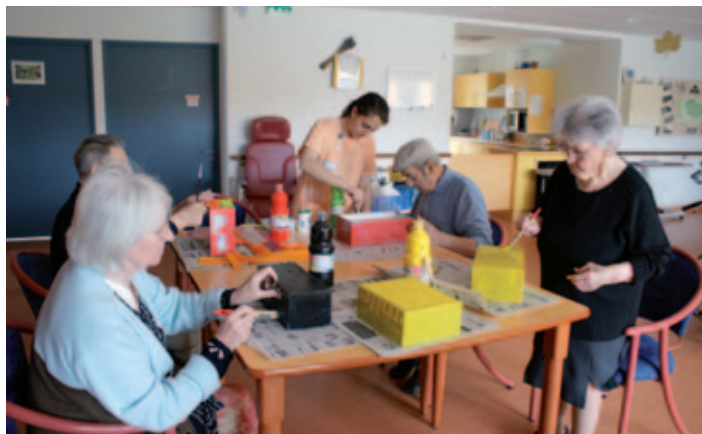
Atelier manuel au CANTOU