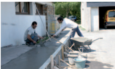
Travaux d'élargissement du quai