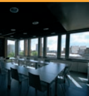
« Localisation des institutions »

AVENUE HENRI-FRÉVILLE, À PROXIMITÉ IMMÉDIATE DE LA STATION DE MÉTRO CLEMENCEAU. DIVERS SERVICES EN REZ-DE-CHAUSSÉE.