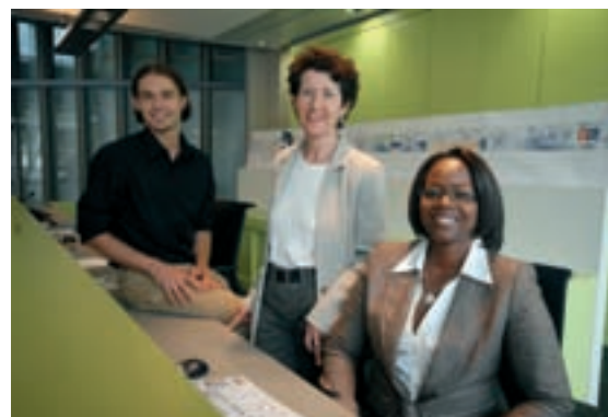
Trois agents assurent l'accueil général à l'entrée du bâtiment avenue Henri-Fréville.