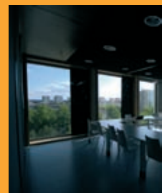
Le bâtiment "rééquilibre la localité dans la ville."