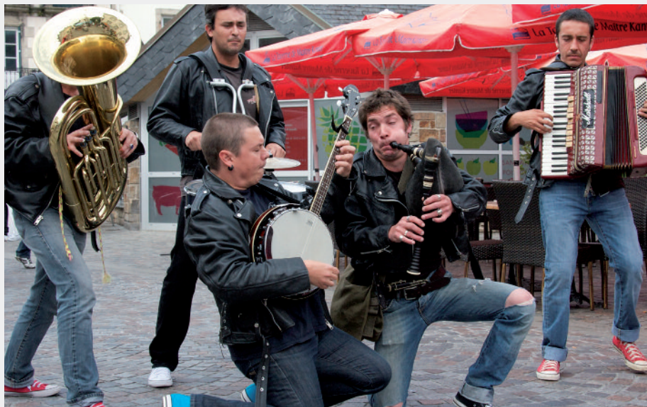
ORCHESTRE ITINÉRANT LANVAUDAN (56) / DURÉE : 3 X 30 MN