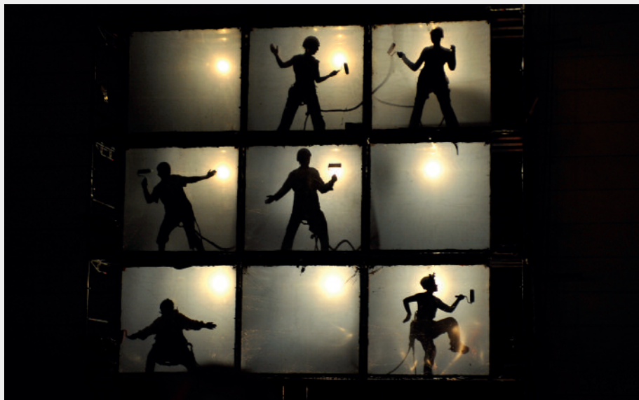
PEINTURES ILLUMINÉES ET CHANTÉES SUR ÉCHAFAUDAGE STRASBOURG (67) / DURÉE : 1H / CRÉATION 2009