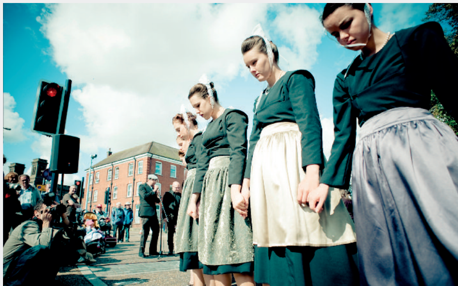
DANSE TRADITIONNELLE REVISITÉE QUIMPER (29) / DURÉE : 50 MN / CRÉATION 2013