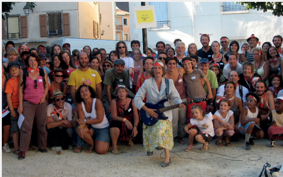
CHORALE PARTICIPATIVE DÉJANTÉE MONTREUIL (93) / DURÉE : 50 MN / CRÉATION 2011