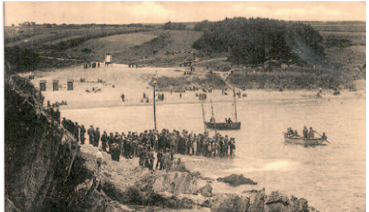
Kerfany vers 1920

L'extension de l'urbanisation est encadrée. Elle doit se réaliser en conti-