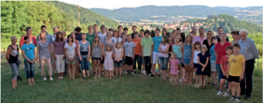
Été 2010, échange de jeunes à Lindenfels