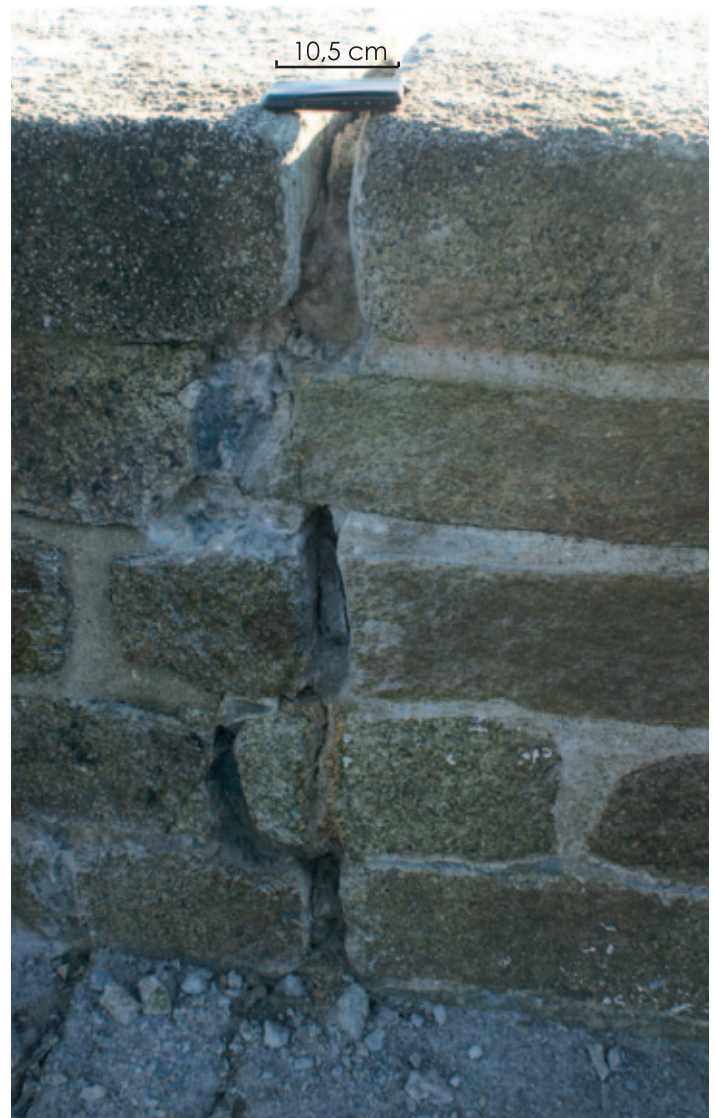
Fissure sur le môle