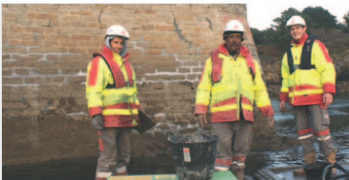
Les salariés de la société Eiffage

Le budget de ces travaux est évalué à 45 000 € non subventionnés. L'Etat du môle, avec risque potentiel de cassure, a contraint la mairie via le budget portuaire à réaliser les travaux pour sécuriser le port avant la période hivernale. ■