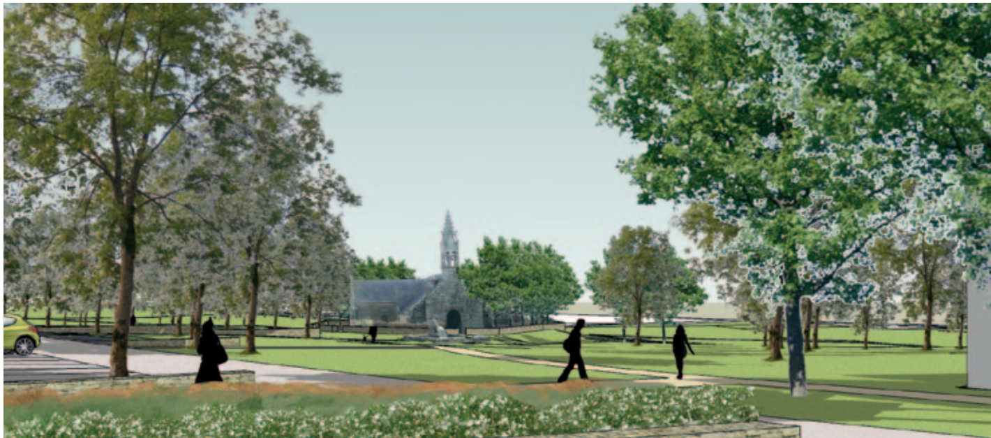
Atelier de l'Ile-Architectes & Paysagistes

Le 3 novembre 2010, les Moëlanais étaient invités à une présentation publique des projets d'aménagements de Saint-Philibert et du Sacré-Cœur. 200 personnes se sont déplacées.