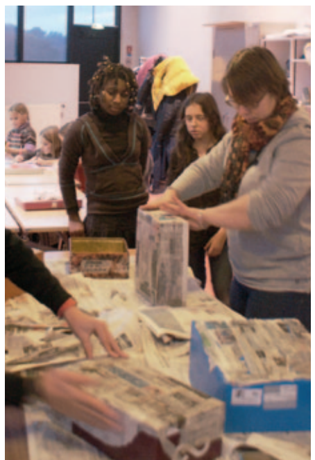
Atelier pour les enfants

Contact : Elisabeth Pellicot 02.98.06.55.92 lezartsmoelanais@orange.fr